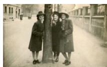
Na ul. Krzywickiego tuż po wojnie