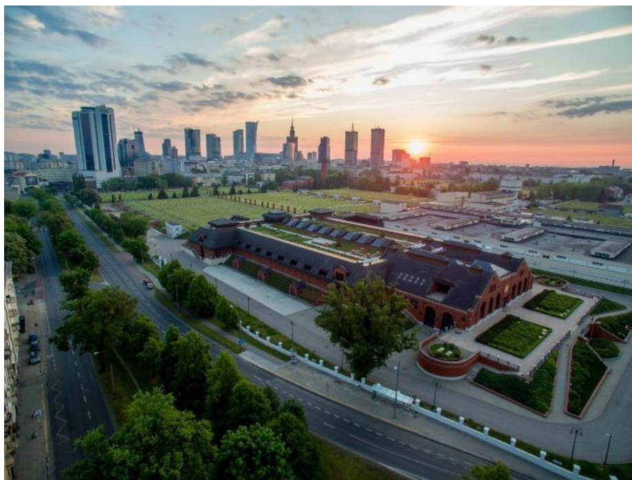
Dzielnica Ochota widziana z lotu ptaka

Materiały wykorzystane w Dodatku Specjalnym pochodzą ze źródeł: By Robert Parma - Praca własna, CC BY-SA 3.0, https://commons.wikimedia.org/w/index.php?