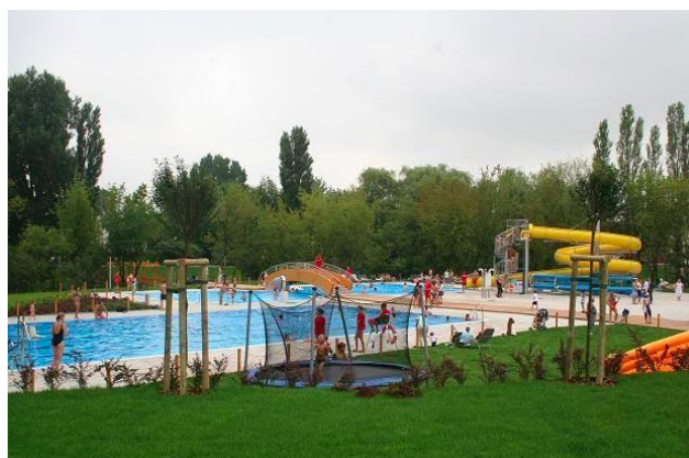
Baseny w Parku Szczęśliwickim

Oba parki mają też place zabaw dla dzieci oraz jeziorka dla psów i kaczek. Na Szczęśliwicach dodatkowo dostępne są otwarte baseny ze zjeżdżalnią i kawiarnią. Niestety, w upalne dni jest tam bardzo tłoczno i nie ma wtedy mowy o pływaniu.