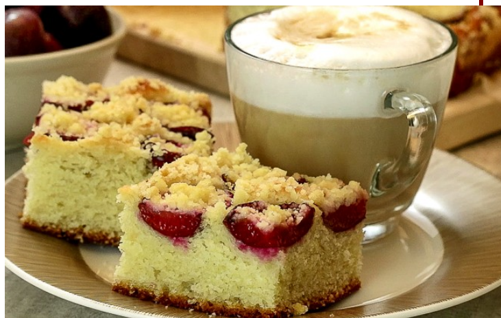
Ciasto drożdżowe w kawiarni Azalia

Naturalnie nie napisałam o wszystkich miejscach, które warto odwiedzić w naszej dzielnicy, ponieważ jest ich zbyt wiele. Propozycje, które przedstawiłam, są jednak świetną zachętą, by po prostu wyjść z domu i samemu przekonać się, co jeszcze skrywa nasza piękna Ochota.