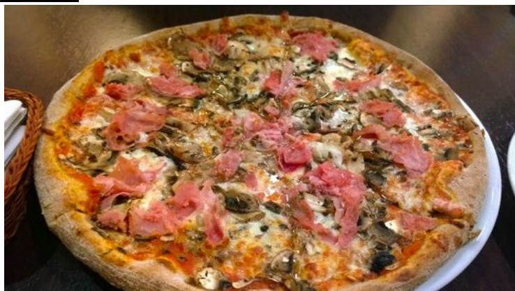
Pizza w Non Solo